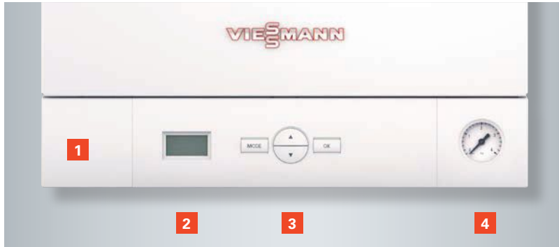
Arıza teşhis sistemine sahip kontrol paneli