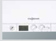
Dijital göstergeli kontrol paneli