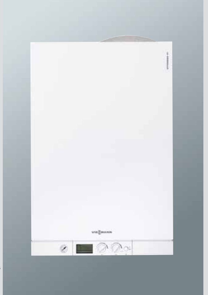
Vitodens 111-W Depo boyler entegre edilmiş gaz yakıtlı kompakt yoğuşmalı kazan (Boyer hacmi 46 litre)