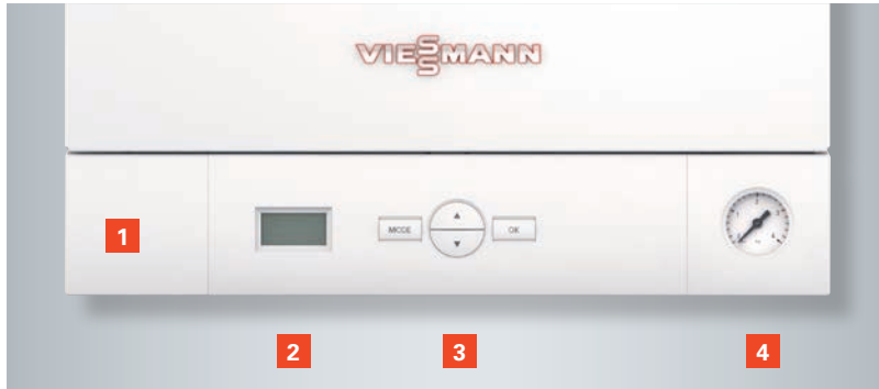
Arıza teşhis sistemine sahip kontrol paneli