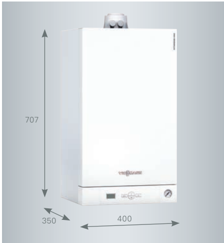
Vitodens 050-W kompakt boyutları ve düşük ses seviyesi sayesinde oturma hacimlerine kolaylıkla entegre edilebilir