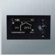
Dijital Vitotronic kontrol paneli

■ Yeni dijital Vitotronic kontrol paneli ile oda sıcaklığına bağlı veya dış hava kompanzasyonlu işletme. Yeni grafik ekran çok satırlı açık metinlerin, grafiklerin ve yardım metinlerinin gösterimine imkan vermektedir.