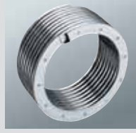
Inox-Radial ısıtma yüzeyi

■ Modülasyonlu, MatriX- silindirik brülör sayesinde düşük zararlı madde emisyonu. Modülasyon aralığı: %20 - 100.